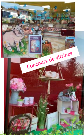
Concours de vitrines

👉 Des jeux et des concours, pros et grand public :