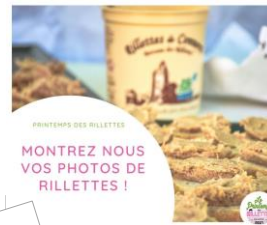
PRINTEMPS DES RILLETTES MONTREZ NOUS VOS PHOTOS DE RILLETTES !