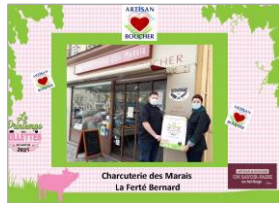
50 animations commerciales chez les Artisans bouchers et charcutiers