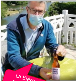
La Bière aux Rillettes de la Brasserie Barreau

👉 De la créativité et encore des surprises :