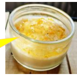
Panna cotta Rillettes et Coteaux du Loir par Pier Ros