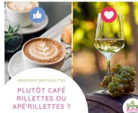
PRINTEMPS DES RILLETTES PLUTÔT CAFÉ RILLETTES OU APÉRILLETTES ?