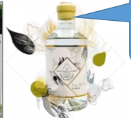
La Distillation de l'Eau de Vie de Rillettes chez la Distillerie du Sonneur