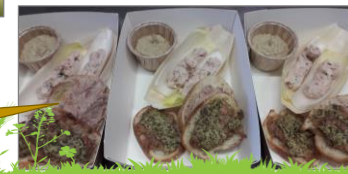
Les Rillettes tranquilles de l'Homme... Tranquille