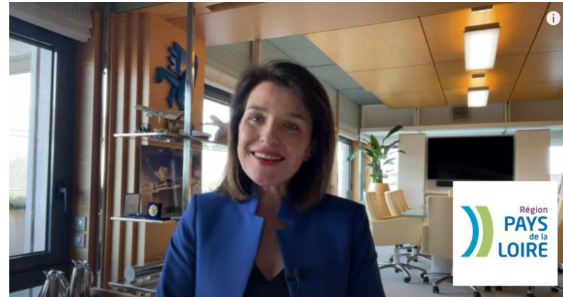
Région Pays de la Loire