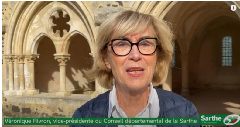
Département de la Sarthe

Merci à nos partenaires institutionnels !