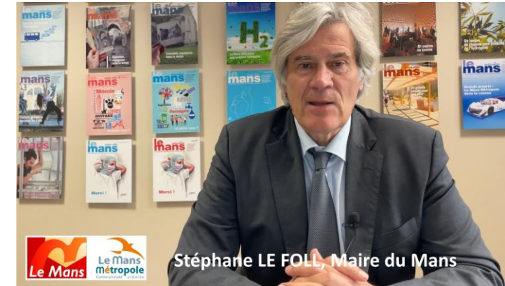
Ville du Mans et C.U.M.